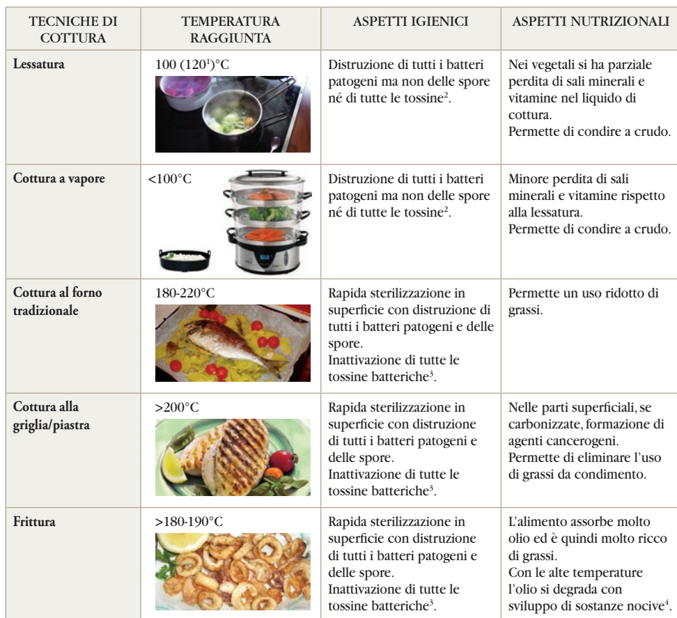
Tabella 3 - Metodi di cottura degli alimenti